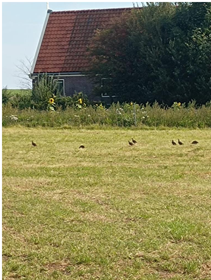
Foto rechts: Patrijzen met jongen in kruidenrijk grasland. Op de achtergrond ligt de keverbank met kruidenrijke begroeiing.

De eerste positieve nieuwsberichten kunnen inmiddels al gemeld worden. Grenzend aan één van de nieuwe keverbanken, in het kruidenrijk gras, is een koppel patrijzen met kuikens waargenomen! (zie foto). En op diezelfde keverbank was zichtbaar dat de zanderige plekken gebruikt waren voor het nemen van een stofbad. De combinatie van keverbank met kruidenrijk gras is hier overigens bewust gekozen. De keverbank biedt bijvoorbeeld jaarrond dekking en voedsel, ook als het kruidenrijk gras wordt of net is gemaaid. Een mozaïek aan maatregelen moet samen met andere landschapselementen een optimaal habitat bieden voor niet alleen patrijzen, maar ook voor vele andere akkervogels.