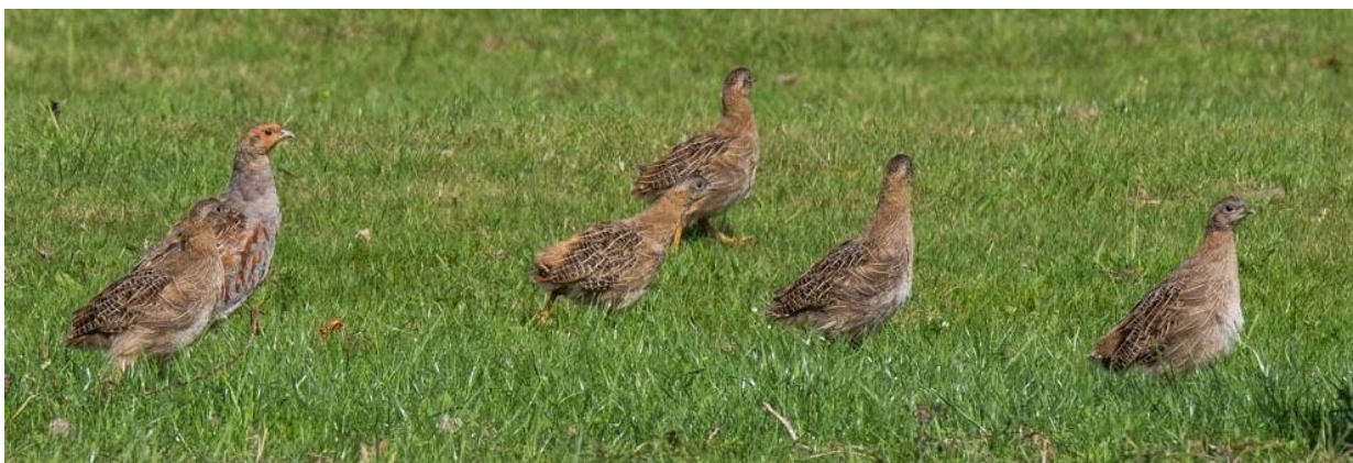
Klucht patrijzen in beeld, gefotografeerd in juli 2023 door Hans Westrik www.actiefmetbeeld.nl

De patrijs op Wieringen staat op de kaart!