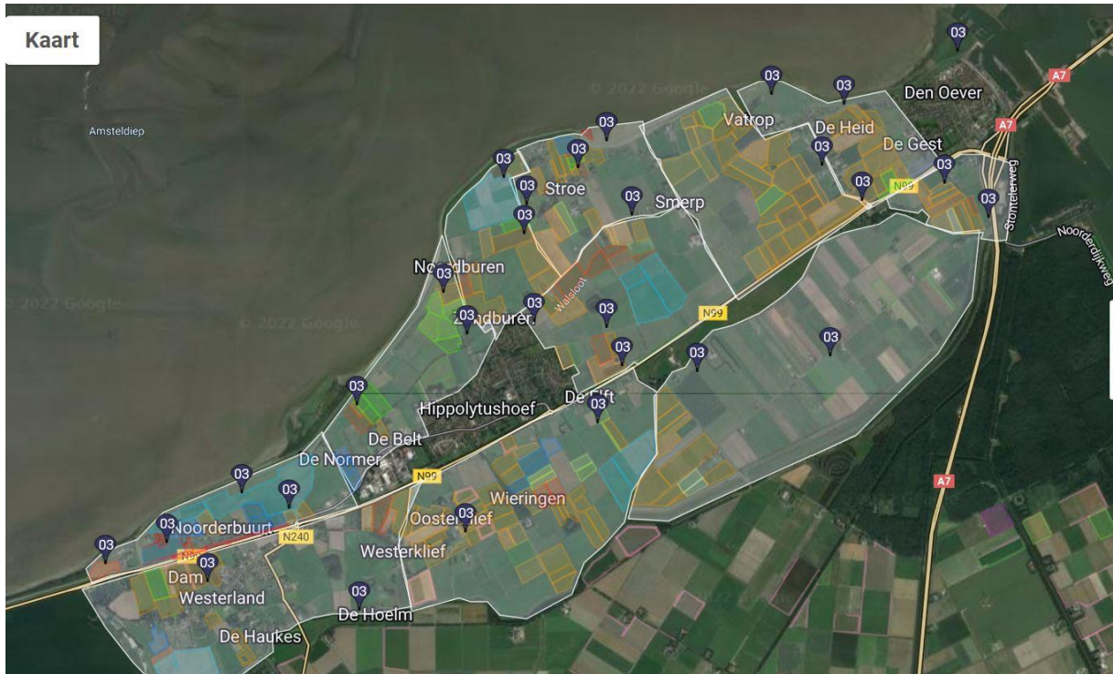
Kaartbeeld verspreiding en aantallen patrijzenterritoria 2022