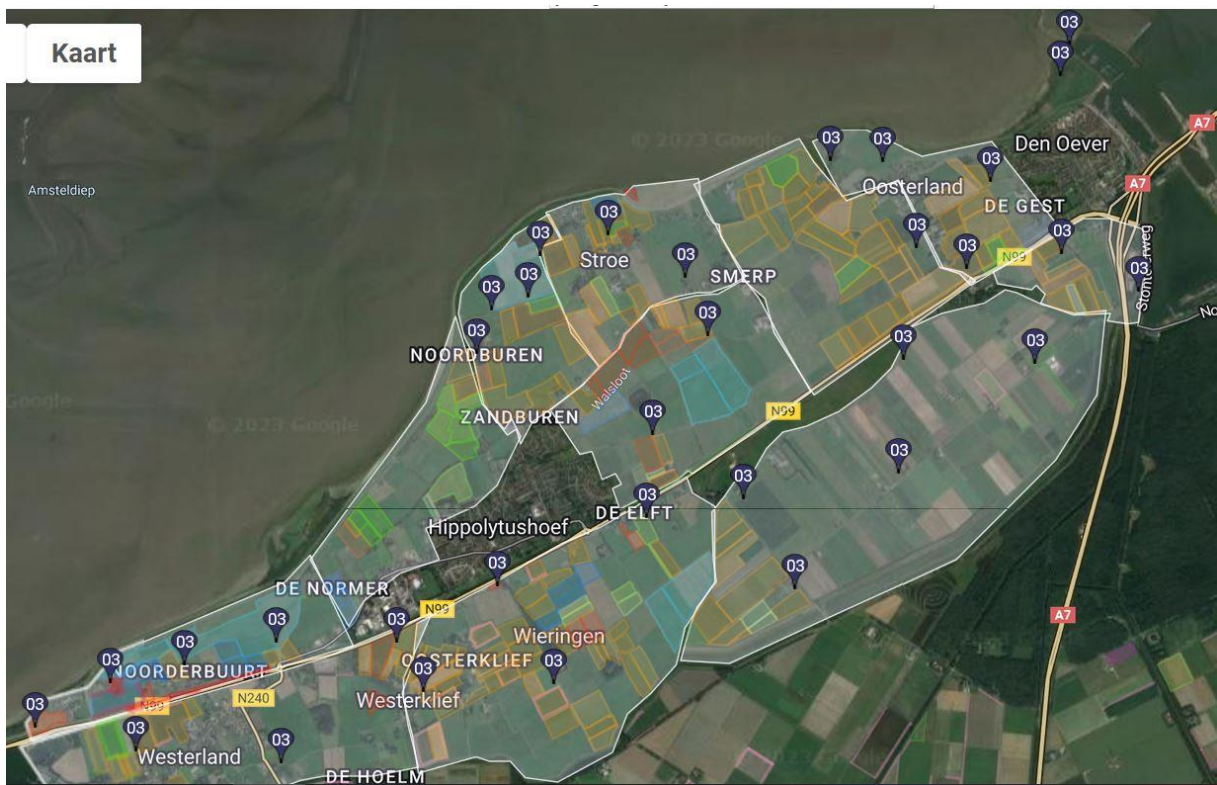
Kaartbeeld verspreiding en aantallen patrijzenterritoria 2023