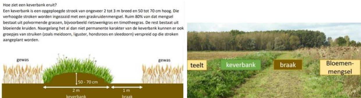
Figuur 3; voorbeeld van een keverbank en combinatie met braak en bloemblok.

Gelukkig is het plan niet blijven steken in de planfase en zijn in 2023 zijn op Wieringen de eerste beheerpakketten afgesloten die specifiek gericht zijn op de wensen van patrijzen. Het gaat hierbij om keverbanken met braak en bloemenblokken (zie onderstaand figuur 3). Deze maatregelen zijn getroffen op die delen van Wieringen waar ze geen negatieve invloed hebben op de andere doelsoorten van ANV Hollands Noorden zoals de Kievit en de grutto.